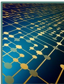
Kiterjedt szakmai hálózat